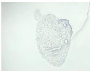
皮肤类器官冰冻切片白片